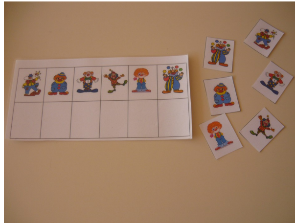
Assembler les clowns identiques (en dessous)