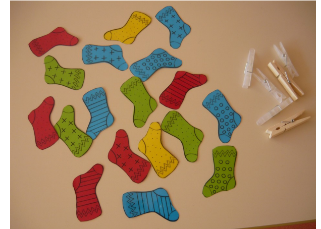
Assembler les chaussettes identiques à l'aide d'une pince à linge

Un chemin de progrès balisé par trois situations de difficulté croissante (superposer, placer en dessous, positions aléatoires des éléments identiques) .